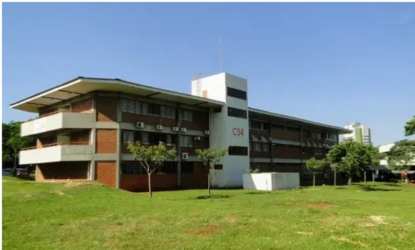
Manifestação contra questionamento da chapa que venceu reitoria será no Bloco C34

A chapa 2 – Pra mudar o DCE, que disputa o Diretório Central dos Estudantes da UEM, divulgou nota/convocação hoje em defesa da chapa 2 – Coragem pra mudar, que venceu a eleição para a reitoria da Universidade Estadual de Maringá no dia 16, em primeiro turno. A chapa do DCE repudia o questionamento que foi feito por uma das chapas derrotadas. O questionamento será votado hoje pelo Conselho Universitário (COU).