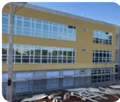
2m de leitura

pela manhã; santo tem fama de casamenteiro