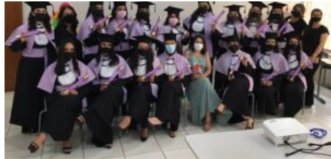
Os formandos de Pedagogia e história

Aconteceu na tarde de ontem, sexta-feira, 29, no Polo da UAB de Goioerê a colação de grau da Universidade Estadual de Maringá do ensino a distância, de 25 formandos de Pedagogia e uma aluna do curso de História. A cerimônia aconteceu de forma online.