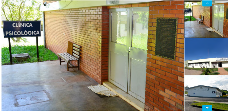
Clínica de Psicologia da UEL