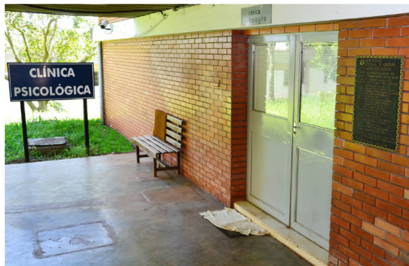
Clínica de Psicologia da UEL

Acolher, atender e orientar a comunidade em relação à saúde mental. Estes são os principais objetivos das clínicas de psicologia presentes nas universidades estaduais de Londrina (UEL), Maringá (UEM) e do Centro-Oeste (Unicentro). As três instituições de ensino superior realizam atendimentos gratuitos para pessoas externas às universidades que necessitem de acompanhamento psicológico.