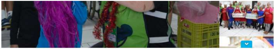
Operação Rondos Paraná encerra atividades com quase 16 mil pessoas atendidas.