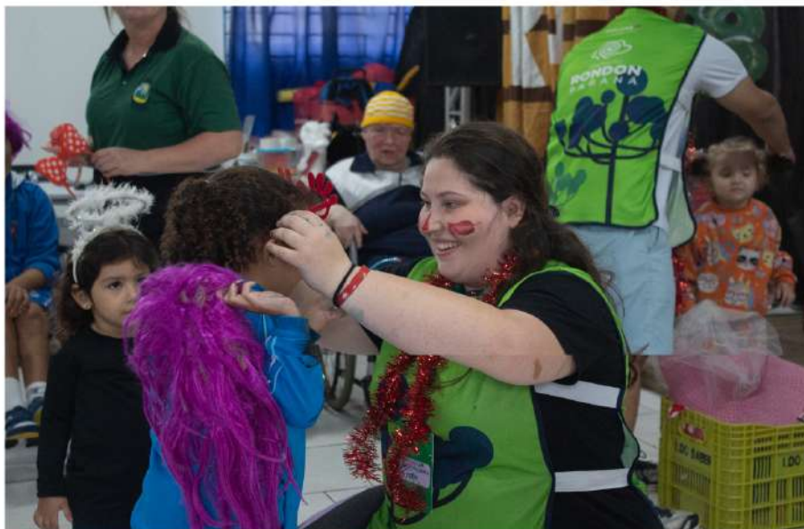
Operação Rondon Paraná encerra atividades com quase 15 mil pessoas atendidas