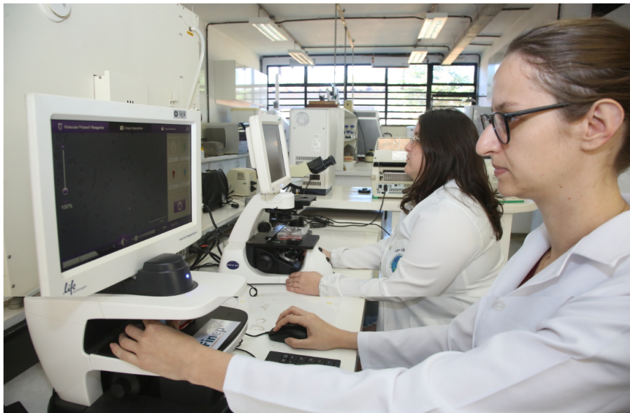
Capes autoriza mais seis doutorado nas universidades estaduais do Paraná. Na foto, laboratórios de pesquisas da UEL