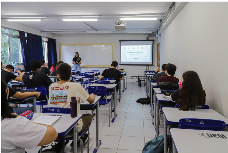
Universidades estaduais fazem teste seletivo e concurso público para 223 vagas