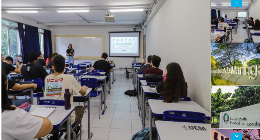
Universidades estaduais fazem teste seletivo e concurso público para 223 vagas