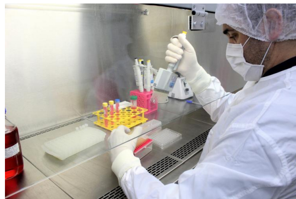
Tecpar é o primeiro laboratório do Sul do Brasil a obter credenciamento nos EUA e União Europeia para realizar ensaio de sorologia antirrábica veterinária.