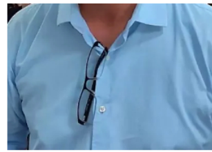
Reforço da UEM e de outros órgãos como OAB, MP e Judiciário garantem êxito do projeto “Construindo Cidadania”, afirmou Ulisses

OFATOMARINGA.COM “que o reforço da UEM e a presença de órgãos como OAB, Poder Judiciário e Ministério Público garantem a formação dos jovens para que eles conheçam cada vez seus direitos e tomem consciência de seus deveres”.