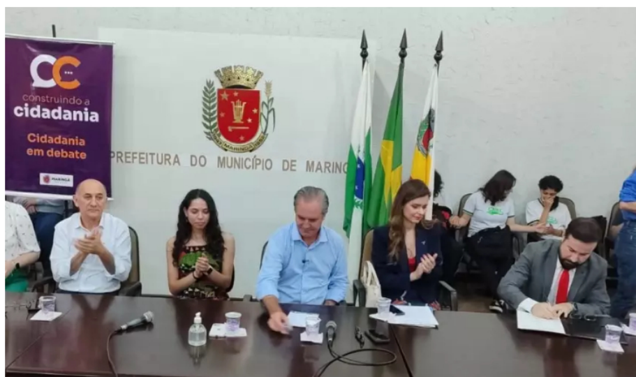
PROJETOS CONSTRUINDO CIDADANIA GANHA REFORÇO DA UEM - foto - OFATOMARINGA.COM

Por O Fato Redação — 17/08/2023 em Maringá