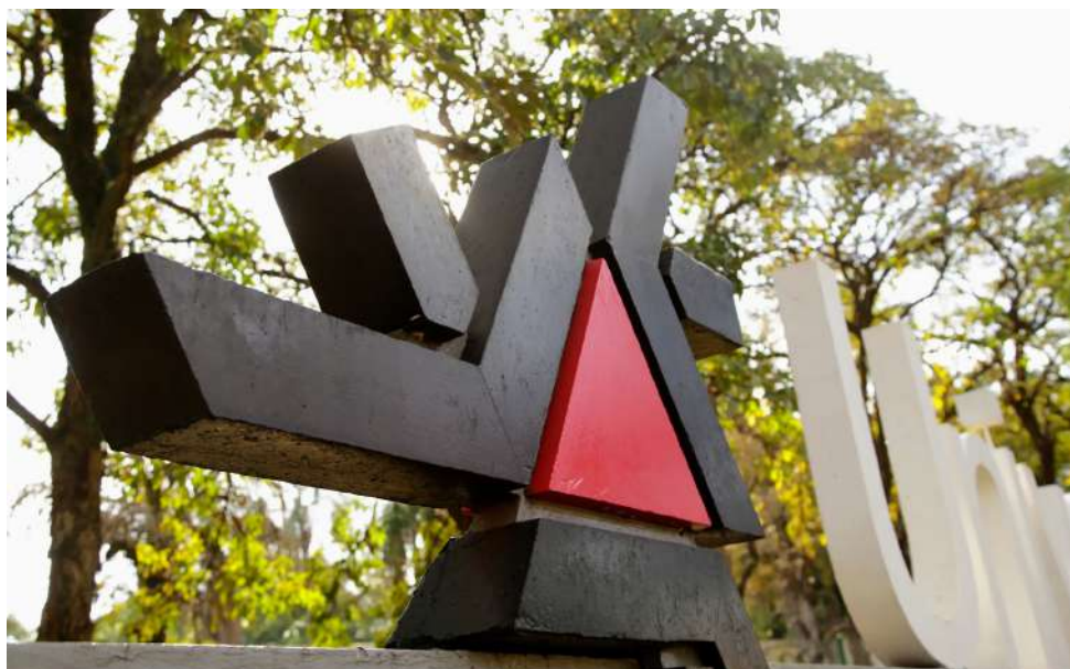
Professores da UEM se tornam membros de projetos do CNPq, ICMBio e Anvisa