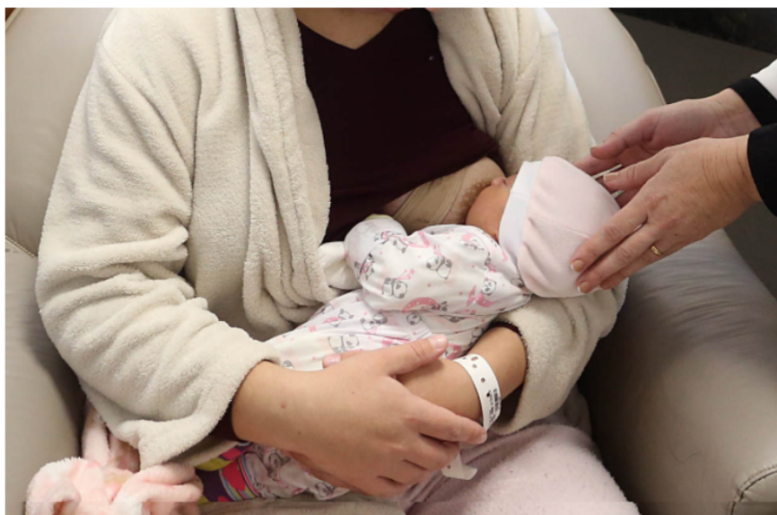
Pesquisa de universidades vai facilitar atendimento à lactante com leite “empedrado”.

Um produto desenvolvido por pesquisadores da Universidade Estadual de Maringá (UEM) e da Pontifícia Universidade Católica (PUC) do Paraná vai facilitar a vida de profissionais no tratamento do ingurgitamento mamário lactacional, conhecido como leite empedrado, proporcionando conforto e alívio às pacientes.