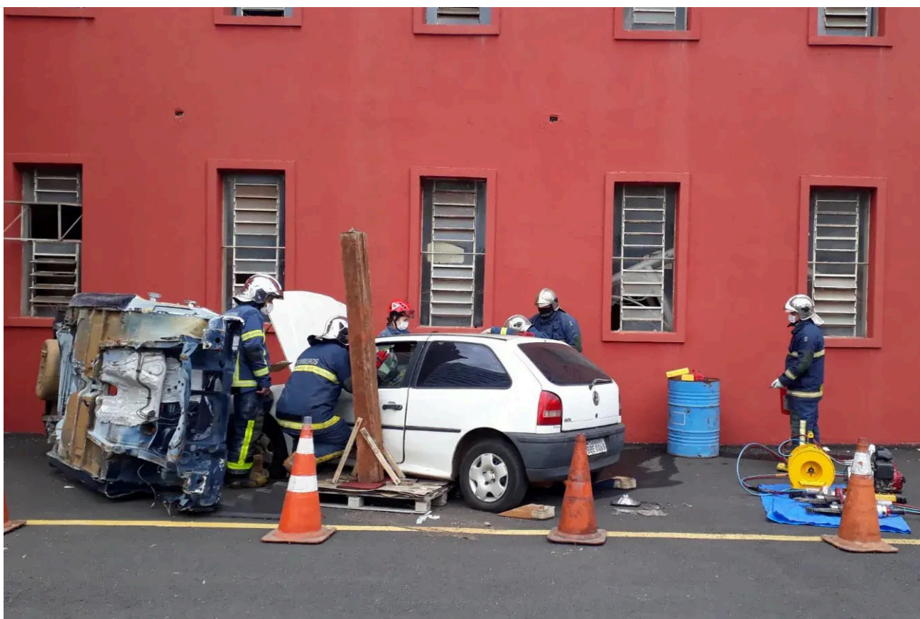
Nova metodologia que reduz o tempo para o resgate de vítimas de acidentes veiculares