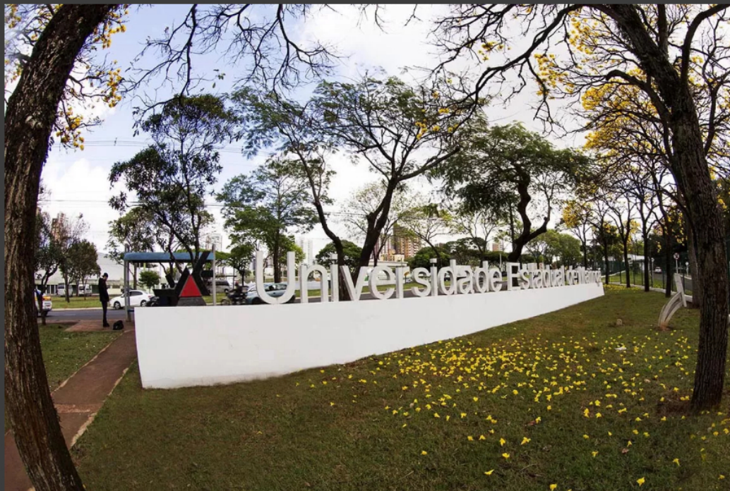
UEM - Reitoria

Por Ingrid Souza — Publicado em 28 de agosto de 2023 - 17:04 — Atualizado em 29 de agosto de 2023 - 08:04